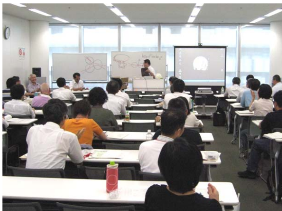
全国から集まった参加者です。参加者は約50名