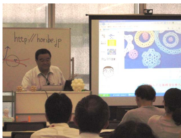
カンプラ工業にお世話になっている旨の説明