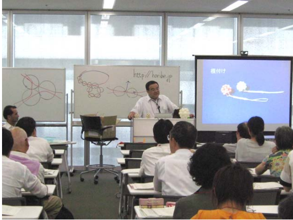
古くから伝わる「根付け」の写真