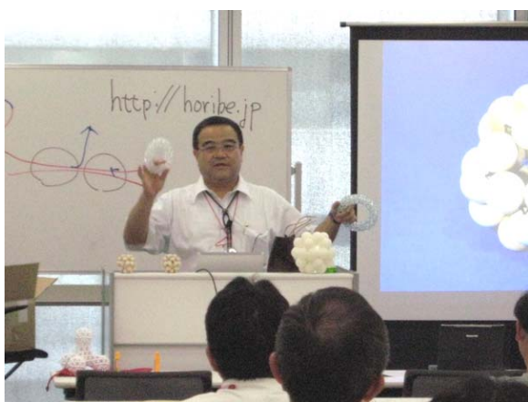
透明ビーズで作ったトーラス形の解説 (トーラス形とは、一般にはドーナツ形のこと)