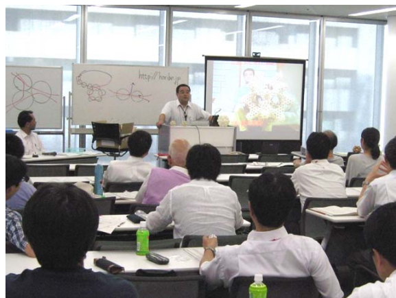
以前作った巨大なビーズ編みの写真を示し解説