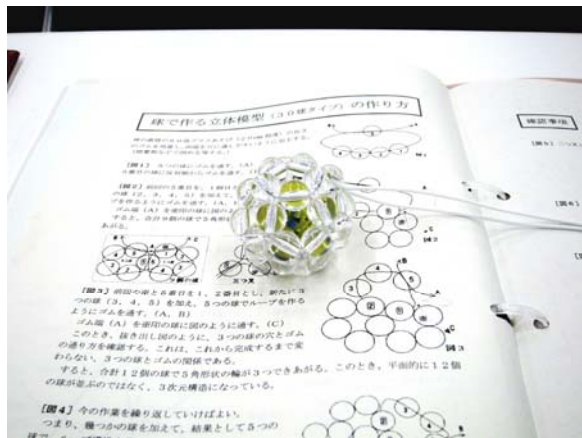
ビー玉（早く完成した人への賞品）を大球として中に入れてある。（下は説明書）

30球のビーズ編みは、早い人で10分程度、多くは15分から25分で完成していました。 ミスして変な形を作ってしまった人は、時間内で完成しませんでした、その後、最終的には完成！！