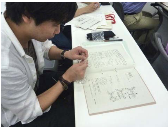
この方は、わりとスムーズに編んでいました。