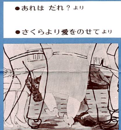
● 道成寺 より