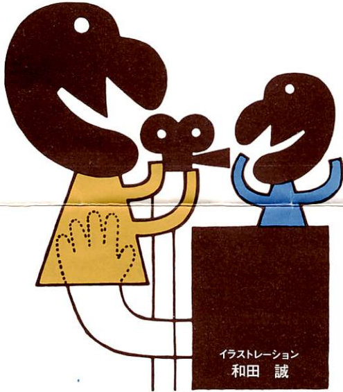
イラストレーション 和田 誠