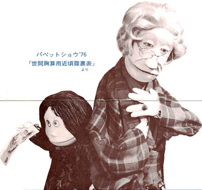
パペットショウ'76 『世間胸算用近頃腹裏表』 より